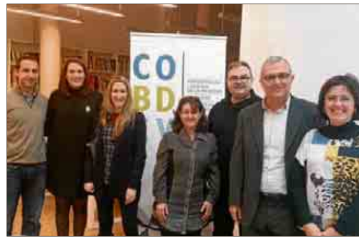
Parte de la junta del COBDCV.

Además, el colegio dedica una gran cantidad de esfuerzos y recursos a actividades formativas, tanto presenciales como online . Entendemos la formación como una herramienta para la especialización y reciclaje de nuestros profesionales. Ahora más que nunca hay que actuar en nuevos escenarios, implicarse al adquirir nuevas destrezas y nueva forma-