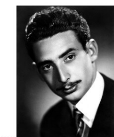
X ANIVERSARI DE LA MORT DE L'ESCRITOR PASQUAL ENGUÍDANOS USACH (GEORGE H. WHITE)