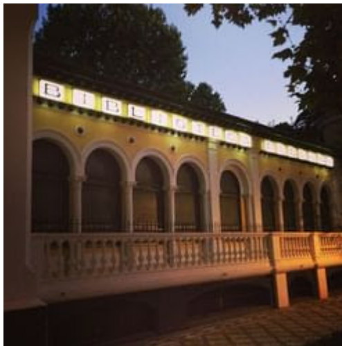
Biblioteca de Granada tallada i fosca.

Però també, en alguns aspectes, apareixem desenfocades. És a dir, no se'ns veu amb nitidesa, no és només que no se'ns vegem les arrugues o que no s'agafe el detall de si portem una taca, és que, en la majoria dels casos, ni tan sols es distingeix molt bé el nostre perfil, què és el que realment som i que els professionals tenim tan clar.