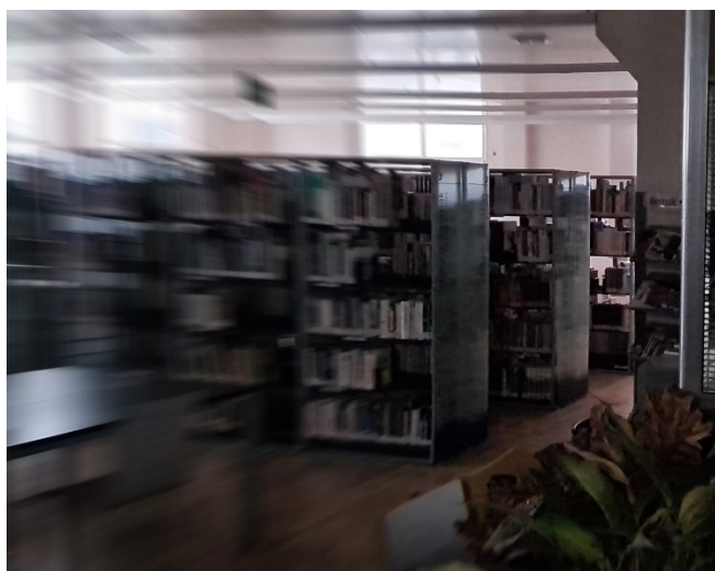
Biblioteca de Muskiz desenfocada.

Des del meu punt de vista, s'hauria de buscar la màxima automatització de l'obtenció de dades. Sobretot per la rigorositat i l'homogeneïtzació...per dir-ho ràpidament, evitar la mà humana en tot el que siga possible. Un clar exemple en els comptatges són els accessos i les permanències; sempre ho dic però google ens diu quan està més concorreguda la nostra biblioteca i per a nosaltres donar aqueixa dada és tot un món. Però tampoc ens equivoquem, encara que la gestió de dades estiga automatitzada, com podria ser el cas de la gestió de les col·leccions, moltes, moltes vegades, obtindre les dades ens costa també molt perquè els models de dades dels sistemes amb els quals treballem no tenen en compte aquestes qüestions, ni les normes anteriors i en molts casos, no tenen ni funcionalitats per a explotar dades i es genera una dependència amb el proveïdors. I encara es complica més quan treballem amb diferents sistemes i de l'un a l'altre canvia tot.